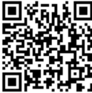
QR-code Leger des Heils